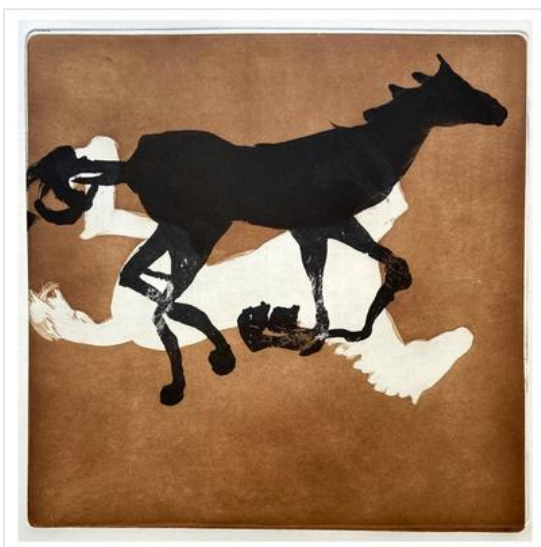
Danielle Noronha Series "Cavalinho", "Carrossel 3", 2022, aquatint

https://www.bellasartes.gov.br/ Museo Nacional de Bellas Artes