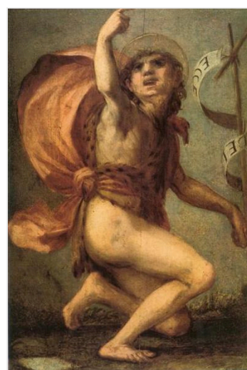
San Giovanni, Rosso Fiorentino , 1521 Style: Mannerism (Late Renaissance) .