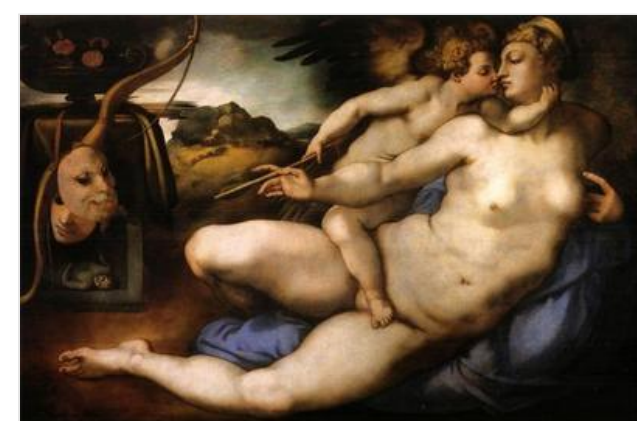
Venus en Cupido is een olieverfschilderij op hout (128x194 cm) van Pontormo , naar een ontwerp van Michelangelo Buonarroti , daterend uit rond 1533 en bewaard in de Galleria dell'Accademia in Florence