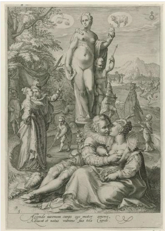
Jan Saenredam, Noordelijke Nederlanden, 1575, naar ontwerp van Hendrick Goltzius